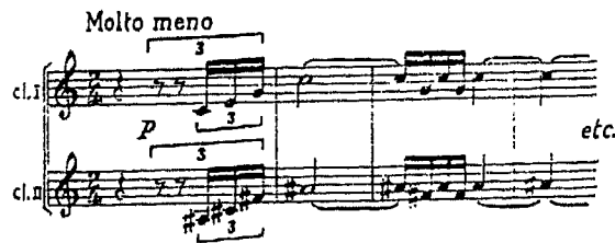
تألف « بتروشكا » المزدوج المقامات .

مولد فكرة باليه بتروشكا وقربان الربيع : نجدنا سترافنسكي في مذكراته عن رؤيا طافت بخياله بينما كان يكتب الصفحات الأخيرة من مدونة الطائر الناري اذ تحيل طقوسا وثنية قديمة رأى فيها شيوخا حكما يجلسون في دائرة يرقبون فتاة شابة ترقص حتى الموت لأنهم قرروا تقديمها قربانا أو ضحية لاله الربيع .